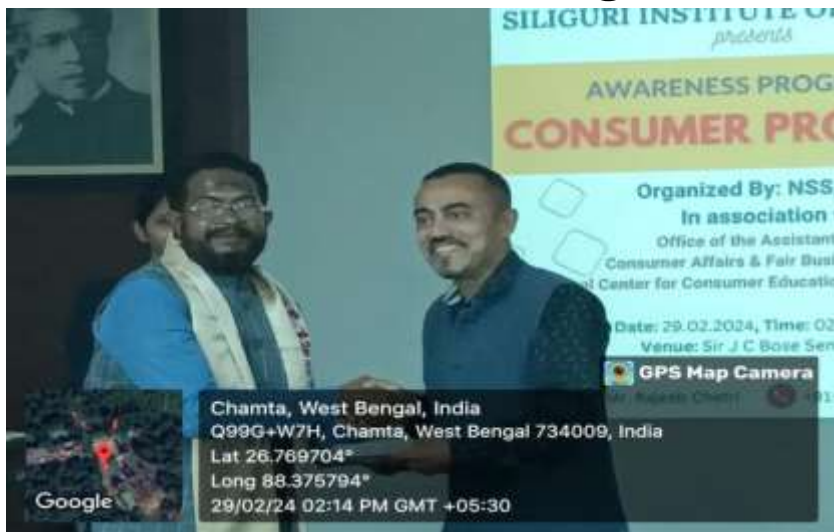
Felicitation of Key note speaker by Jt. Convener - NSS