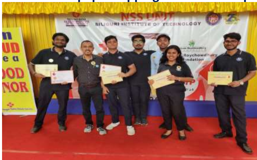
Blood Donors Certificate Distributions