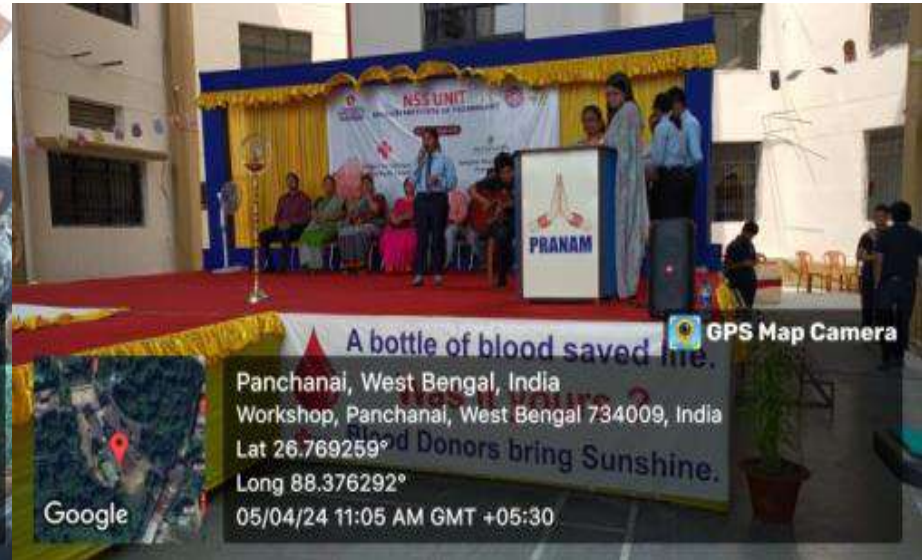
Counseling of blood donors by NSS volunteers