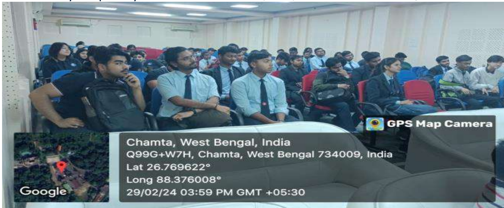
Students attending the seminar with rapt attention