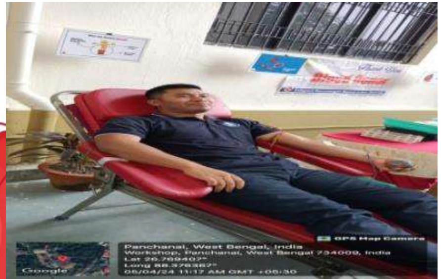
Students donating Blood